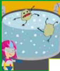
DESBASTE / TAMIZADO