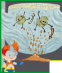
DESARENADO / DESENGRASADO